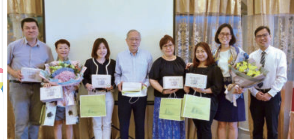
校監(左二)及校董會成員出席教師午餐

本校法團校董會由熱心教育的專業人士組成，包括教育大學及澳門大學客席教授、前教育局官員、商界高級行政人員和律師等。校董會對學校長遠發展具有清晰的理念和實際的管理經驗。校內事務則由校長聯同副校長及各科、組主任負責統籌。校董、教師、家長及校友緊密合作，發揮校本管理及共同參與的精神。