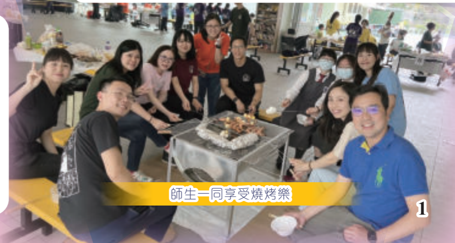
師生一同享受燒烤樂

本校師資優良，教學經驗豐富，師生比例為1比13。校內所有常額教師均具備學士學位並曾受正規師資訓練，其中碩士或以上佔40%。本校亦經常舉辦教師研討會及跨校交流等活動，持續提升教師專業質素。本校教師投入教學工作，具有強烈的使命感，時刻關注學生的表現，並與學生建立深厚的情誼，予以關懷和指導。