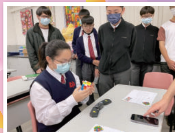
數學周活動——扭計骰比賽