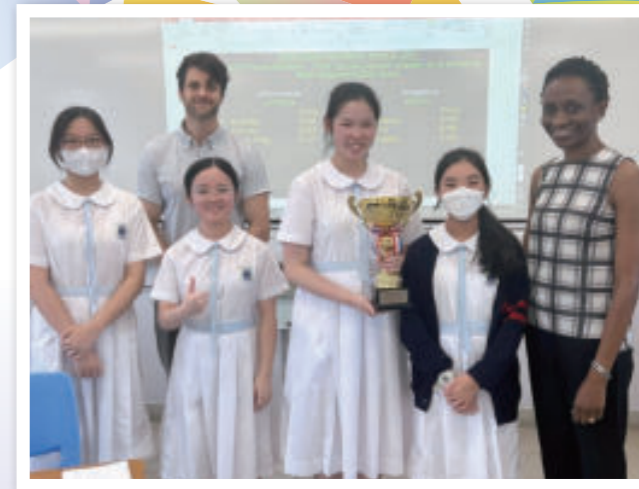
English Debating Team winning the HKSSDC Grand Final for the second year running