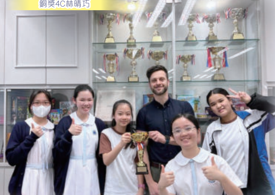
2022-23香港中學英文辯論比賽 (港島及新界II) 總決賽冠軍