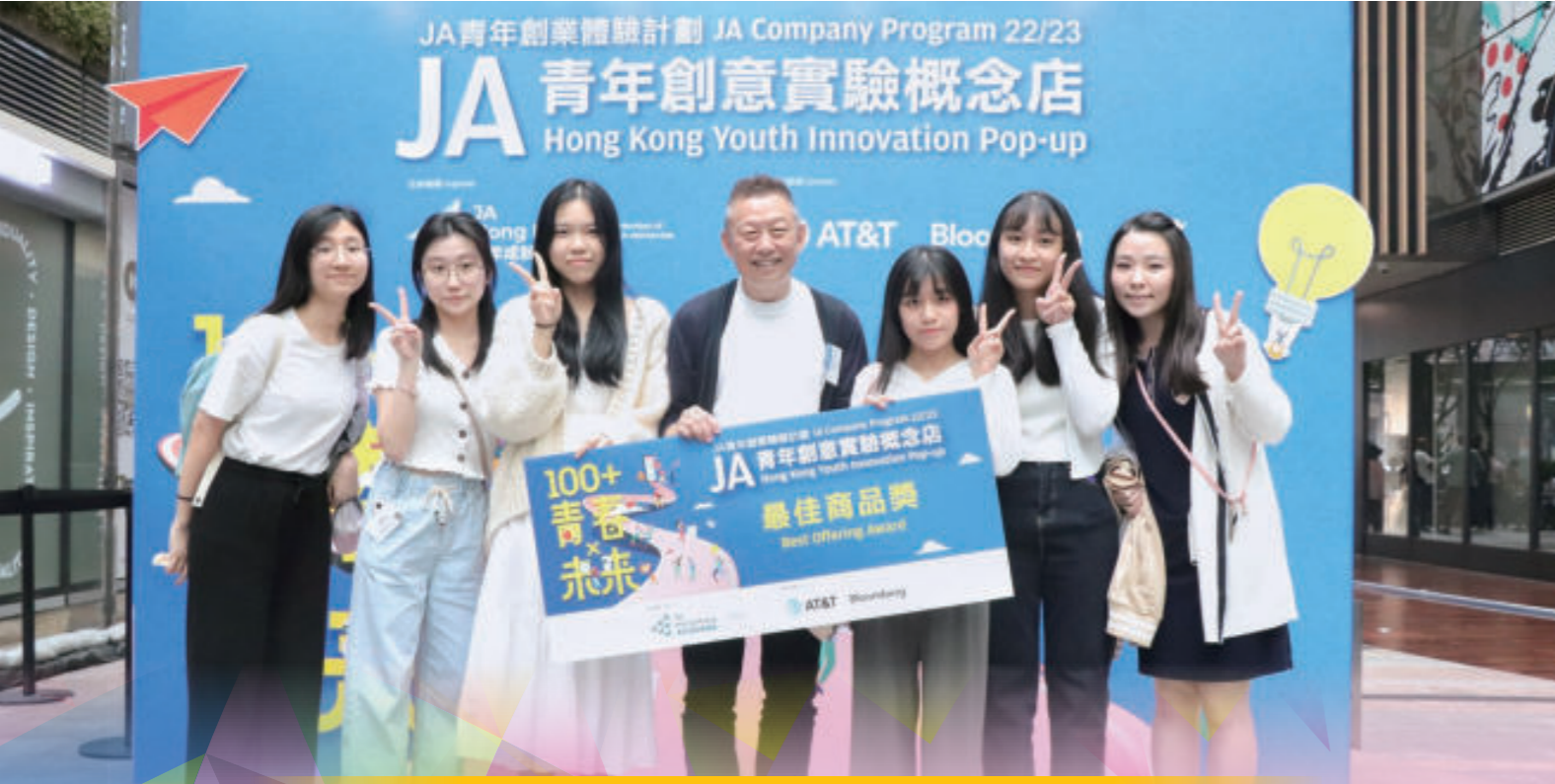
學生在「JA青年創意實驗概念店比賽」獲最佳商品獎及最佳匯報獎