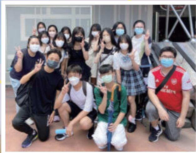
迪士尼工作體驗坊