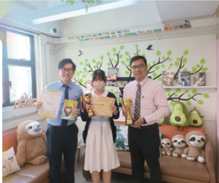
第九屆陳贊一博士聯校微型小說創作獎——高中組季軍

本科定期與教育局合作，設計及檢視校本教材，又參加香港中文大學「優質學校改進計劃」，以進一步提升教學質素。教師亦經常鼓勵及安排學生參與文學營、聯校讀書會及各類語文、文學活動，故本校學生在朗誦、徵文及辯論等多個公開比賽中均展現優秀的學習成果。