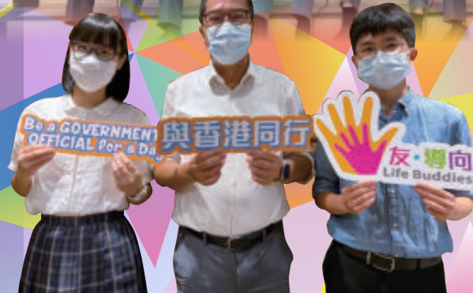
與香港同行——「友·導向」師友計劃

除此之外，本校亦成功安排高中同學參加「與香港同行」計劃中的「友·導向」師友計劃，讓學生有機會成為政府高級官員的一天「工作影子」，近距離體驗官員的工作和政府的運作，協助他們建立正面的價值觀和態度，鼓勵他們從不同角度思考生涯規劃，並啟發他們發奮向上，以信念和毅力達到目標。