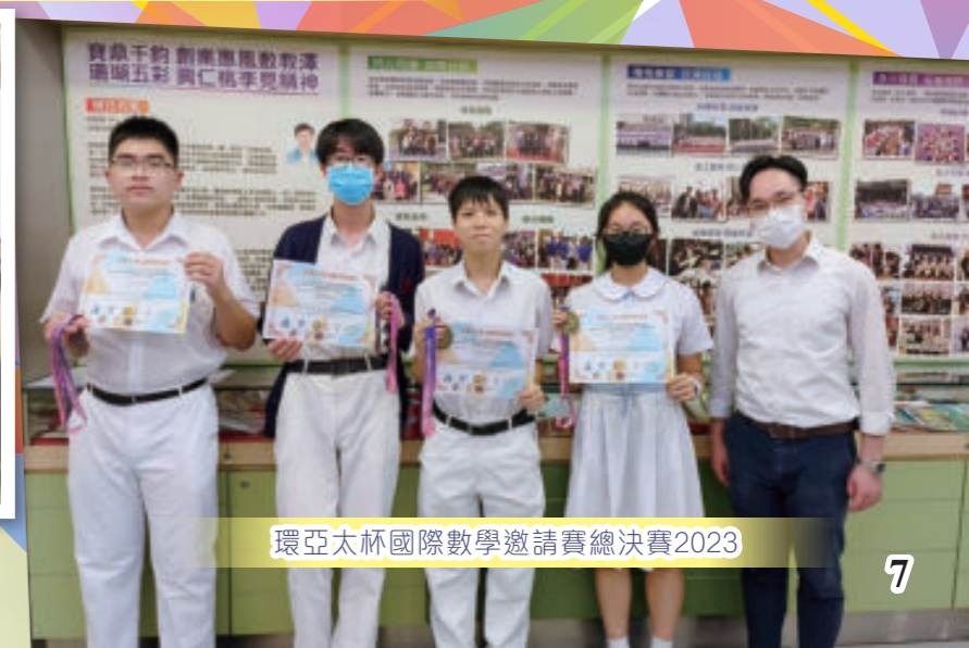
環亞太杯國際數學邀請賽總決賽2023