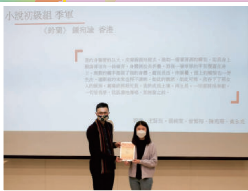
第49屆青年文學獎小說初級組季軍