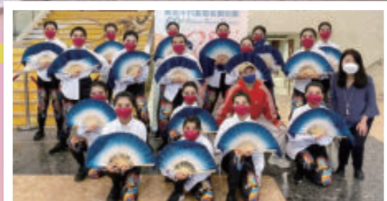
第59屆學校舞蹈節——中學組爵士舞及街舞乙級獎