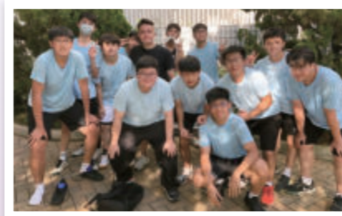
荃灣及離島區校際手球賽男子高級組季軍