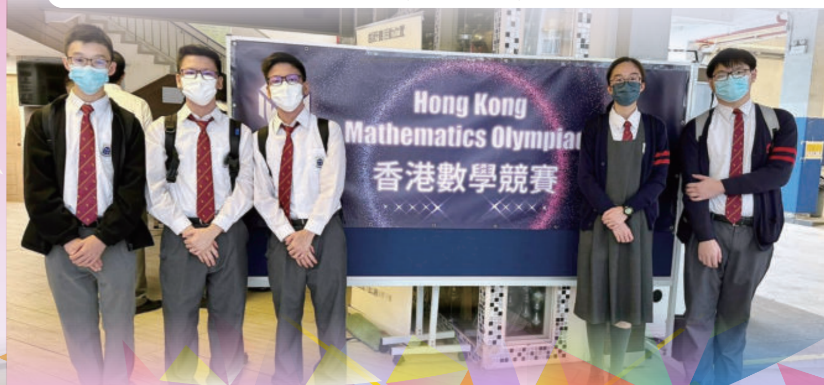
第四十屆香港數學競賽

The Mathematics Department regularly organises whole-school mathematics competitions and activities, with "Mathematics Week" being the largest in scale. During the week, students would be challenged and have fun at the same time. Our students have achieved numerous awards in external Mathematics competitions and have achieved excellent performance in public examinations.