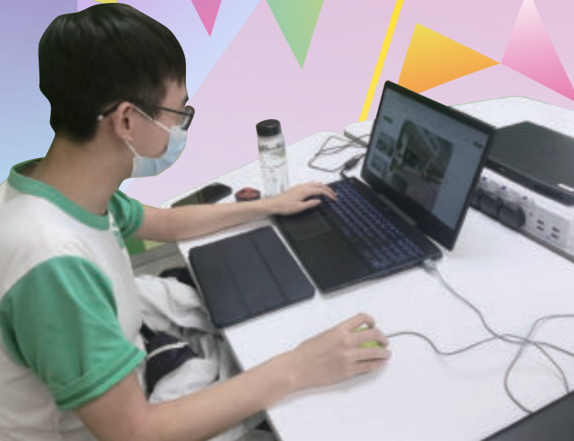
學生參與校園VR虛擬導賞影片製作

本校學生積極參加校外創科活動。修讀企業、會計與財務概論科的學生組成團隊，參加「JA青年創意實驗概念店比賽」，觀察社會的需求，並發揮創意，嘗試設計、生產、售賣原創產品。STEM小組成員參加「加拿大國際學校水底機械人邀請賽」，奪得全場第二名。