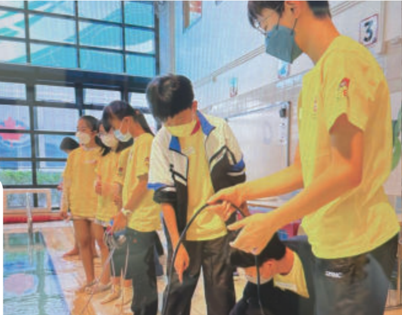
火箭車STEAM專題探究計劃

學校積極推動創科教育，早已將初中電腦科及設計與科技科整合為「創新科技科」(Innovative Technology)，並開展跨學科STEAM課程，緊貼資訊科技的新趨勢，培養學生的創新和解難能力。學校更安排學生參與校內及校外的創科活動，豐富他們的學習經歷。