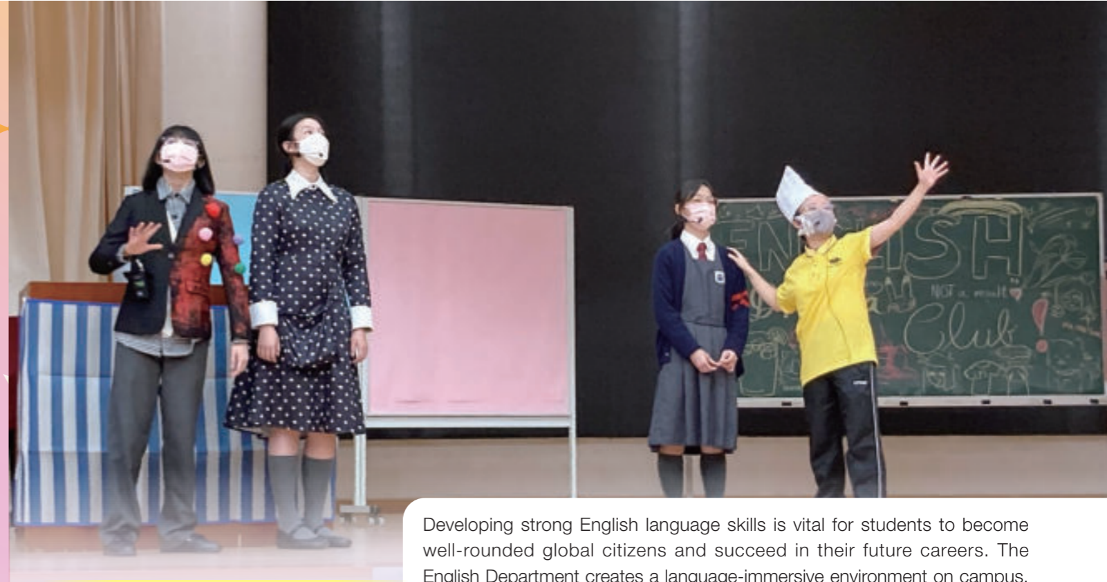
A live drama showcase by the English Drama Club on Gratitude Festival