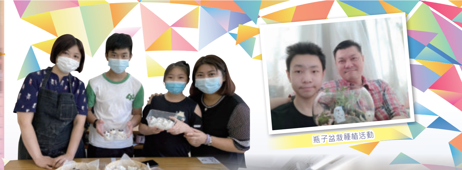
瓶子盆栽種植活動