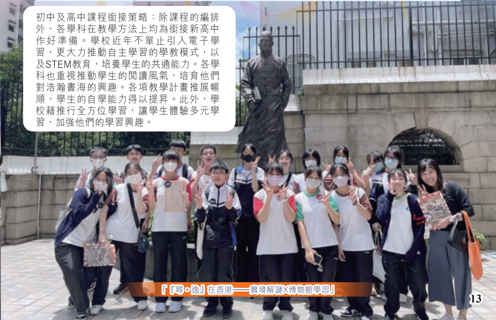
『『尋·逸』在香港——實境解謎X博物館學習』

初中及高中課程銜接策略：除課程的編排外，各學科在教學方法上均為銜接新高中作好準備。學校近年不單止引入電子學習，更大力推動自主學習的學教模式，以及STEM教育，培養學生的共通能力。各學科也重視推動學生的閱讀風氣，培育他們對浩瀚書海的興趣。各項教學計畫推展暢順，學生的自學能力得以提昇。此外，學校藉推行全方位學習，讓學生體驗多元學習，加強他們的學習興趣。