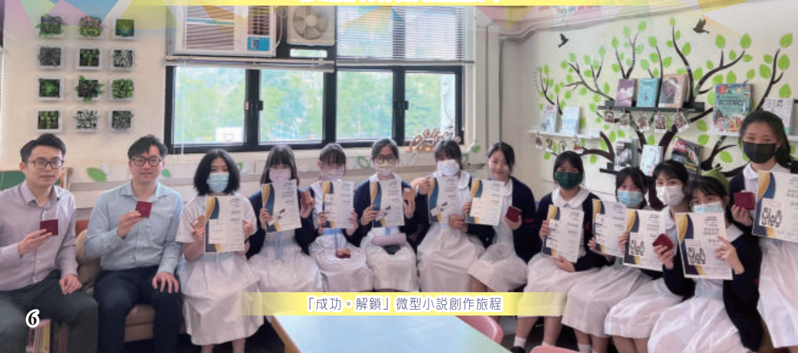
「成功·解鎖」微型小說創作旅程