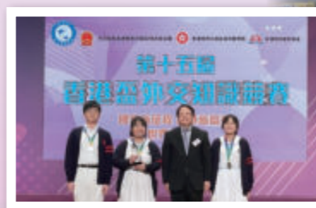
第15屆「香港盃外交知識競賽」先鋒賽銀獎、最踴躍參與學校獎