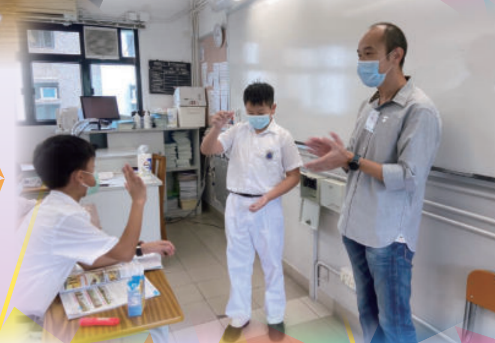
家長於午膳期間和同學一起表演魔術

學校定期舉行家長日、家長研討會及親子活動。透過家長教師會活動加強學校與家長的聯繫，幫助學生適應校園生活，家長更在學校活動中踴躍擔任義工。