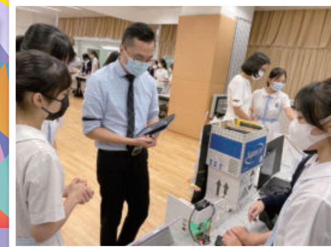
邀請校外專家為智能家居評分