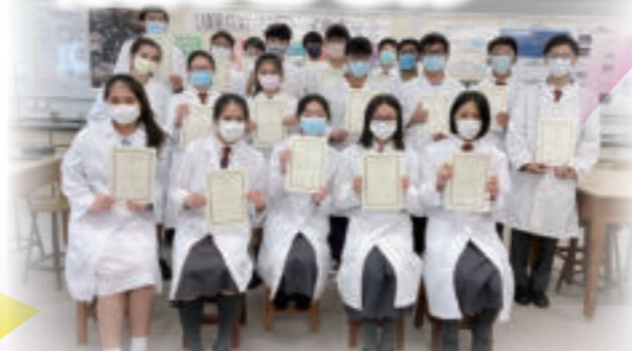
「化學家在線」自學獎勵計劃白金證書鑽石證書