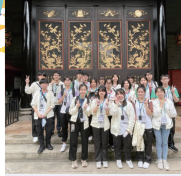
中五級公民科考察活動

為迎接3-3-4新學制，本校始於2005年設立新高中課程統籌委員會，以籌劃及建構新高中課程。學校同時把握新學制的機遇，檢視課程的架構及課時的安排，而新高中課程亦得以在本校順利推展。本校致力為同學提供一個寬廣和均衡的課程。在新高中學制下，本校高中學生除修讀4個核心科目外，並可在12個選修科中選讀3科，以及報讀應用學習課程。另外學校會為新高中同學提供多元化的「其他學習經歷」，包括德育及公民教育、體育發展、藝術發展、社會服務及與工作有關的經驗。