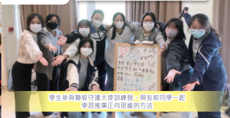
學生參與聯校守護大使訓練營，與友校同學一起學習推廣正向思維的方法