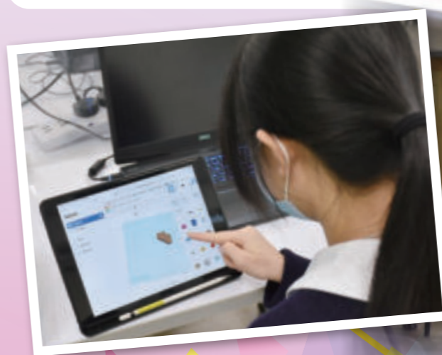
學生運用3D列印技術，設計對稱立體