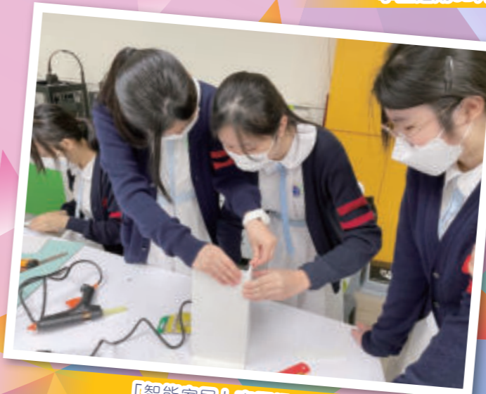
「智能家居」專題探究計劃

創新科技科(Innovative Technology)是本校初中的校本課程，揉合了電腦科及設計與科技科的元素，既傳授現代科技知識及技能，亦培訓學生動手實踐的能力。創新科技科的課程內容豐富，除了提升學生的基本電腦知識和應用技能外，亦加強他們的編程基礎，為他們日後在相關領域的發展打下鞏固根基。本學年學校參加了中文大學賽馬會「智為未來」計劃，優化創新科技科的校本課程，加強學生對人工智能的認識。