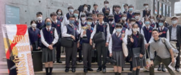
聯校音樂大賽管樂團銅獎