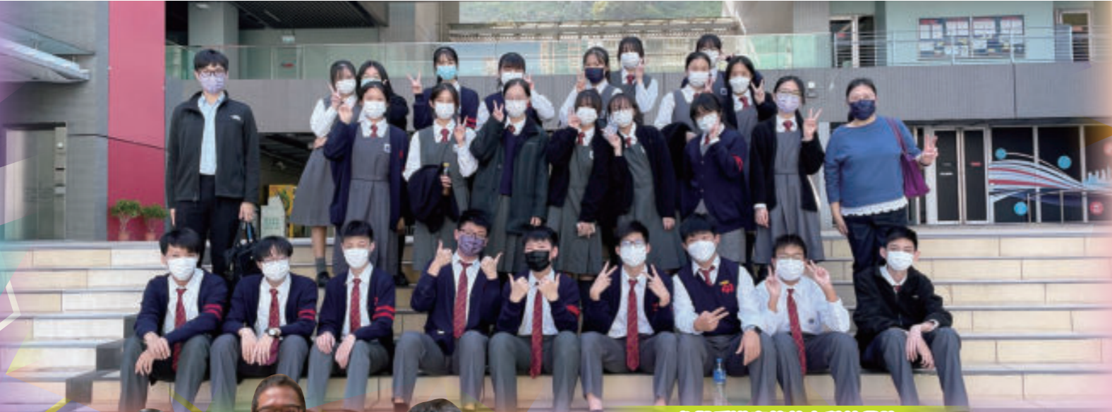
參觀香港高等教育科技學院