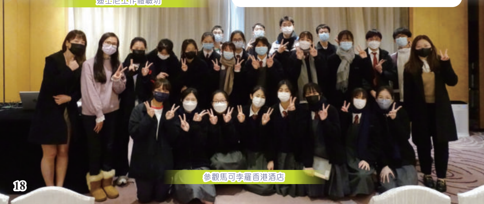
參觀馬可孛羅香港酒店