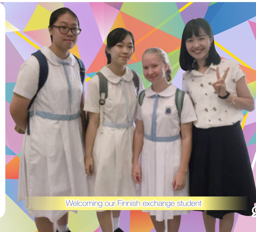
Welcoming our Finnish exchange student

學校亦透過課程設計和閱讀計劃，全面地提高學生的英語能力，並藉英語嘉年華、英語話劇、辯論及演講比賽、安排外籍交換生入讀本校和境外交流團等活動，鼓勵學生活用英語，提升自信。