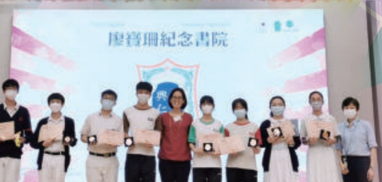
泰國國際數學競賽總決賽2022-23 (香港賽區) 銅獎