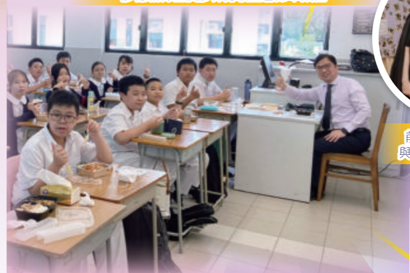
校長與中一班同學午餐