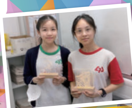
雕刻小夜燈工作坊