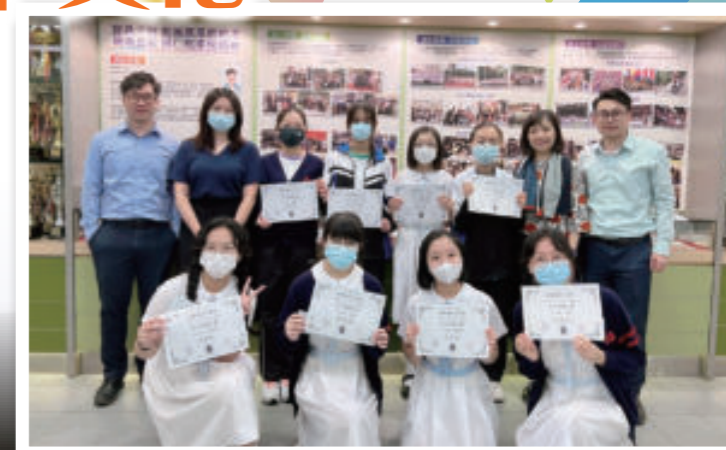
「欣·感」演講比賽得獎學生

為提升校園欣賞及感恩文化，課外活動組舉辦「校園感恩祭」，讓學會及學生小組以感恩為主題，設置不同攤位，營造感恩校園。各科組亦以「欣賞」和「感恩」為主題舉辦活動，例如中文科舉辦「欣·感」演講比賽，學生在台上分享對「欣·感」的見解及經驗，盡顯他們學思並重、知行合一的治學精神。