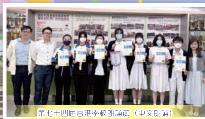
第七十四屆香港學校朗誦節 (中文朗誦)