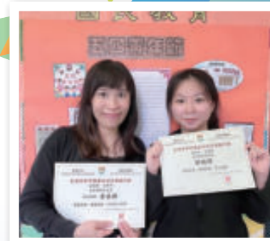
第13屆「全港中學中國歷史研習獎勵計劃」三等獎