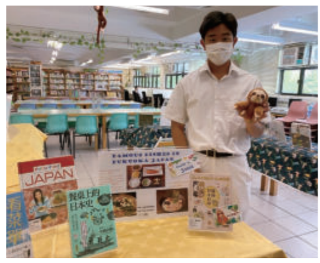
日本交流生於「餐桌上的幸福」主題書展以英文分享日本飲食文化