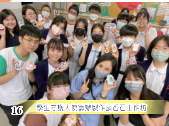
學生守護大使籌辦製作擴香石工作坊

學校致力於識別和支援受情緒困擾的學生，學生守護大使在當中扮演重要的角色。學生守護大使接受一系列的校本及聯校培訓，透過互動的工作坊學習關心朋輩的實用技巧。完成培訓後，守護大使更在學校籌辦「身心靈健康周」，通過攤位遊戲及工作坊，推廣友善互助的校園文化，加強全校師生對精神健康和正向思維模式的認識。